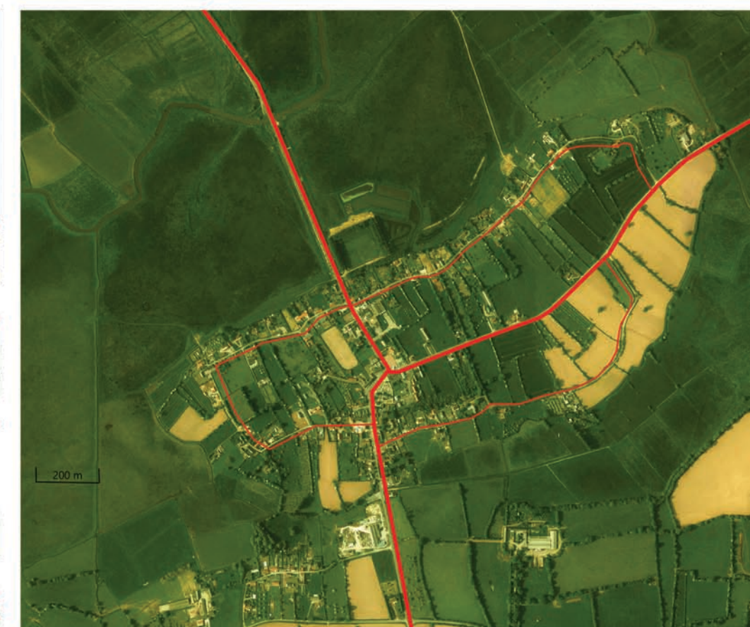
Vue google earth actuelle de Tribehou